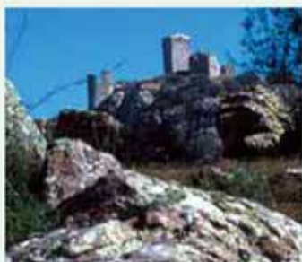
Castillo de Alange

En las cercanías de Alange se pueden visitar las poblaciones de Palomas , Puebla de la Reina y Hornachos con extraordinarias muestras del arte mudéjar en sus iglesias y pinturas rupestres también en Hornachos, que cuenta con un Aula de la Naturaleza