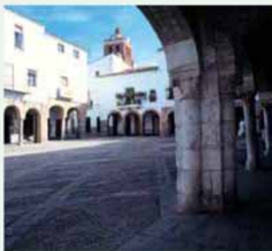
Zafra. Plaza Chica

Mérida , a unos 70 kms., también se encuentra como una excelente posibilidad, para conocer su Conjunto Arqueológico declarado Patrimonio de la Humanidad, al que se suma el Museo Nacional de Arte Romano.