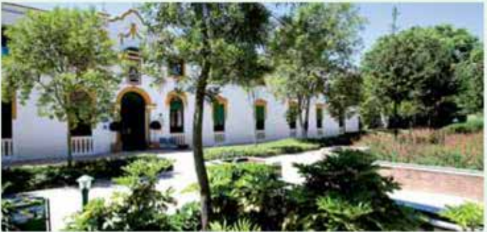
Entrada principal del Hotel Balneario