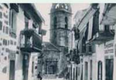
Baños de Montemayor en 1912