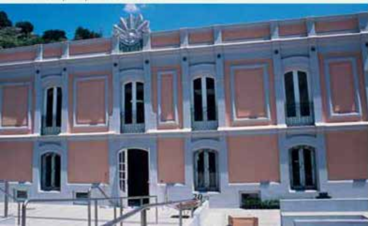
Fachada principal del Balneario

a la historiografía extremeña datos y descubrimientos arqueológicos que demuestran la gran importancia de los baños en época romana y la fortuna de poder ver in situ las magníficas restauraciones y adecuaciones de las primitivas termas romanas.