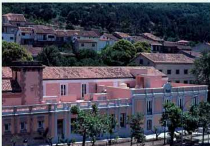
Vista del Balneario y parte alta de Baños de Montemayor