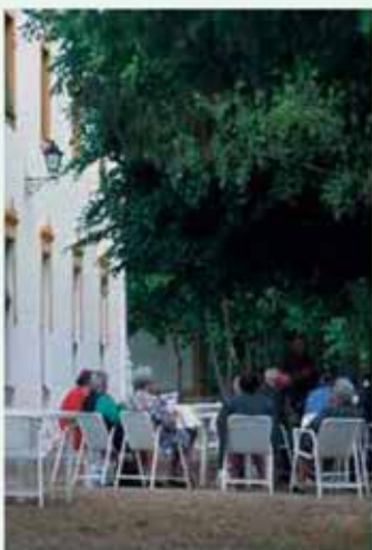
Zona de descanso