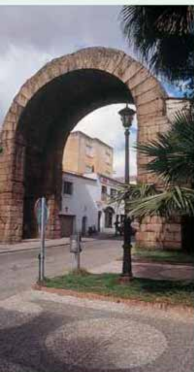
Mérida. Arco de Trajano