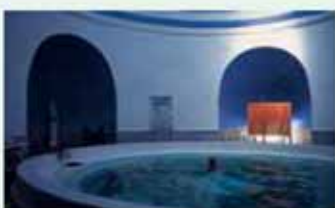
Terma romana de hombres