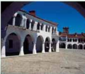
Garrovillas. Plaza Mayor porticada