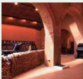
Malpartida de Cáceres. Museo Vostell