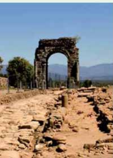
Arco romano de Cáparra