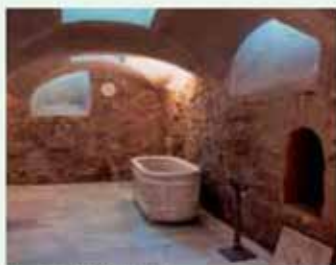
Museo del Balneario.