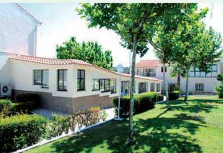
Vista exterior del Hotel-Balneario