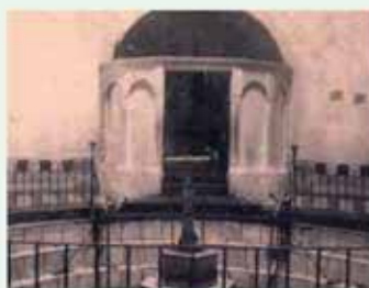
Baños de mujeres. 1910

No faltan numerosas e interesantes referencias históricas al Balneario de Alange, en textos y fuentes que nos hablan de la ocupa-