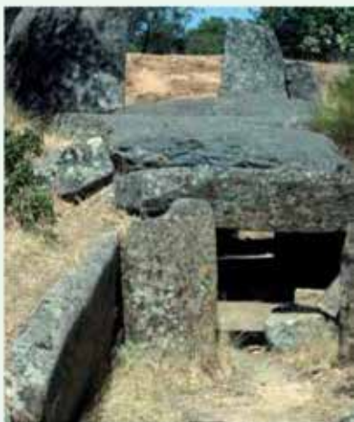
Dolmen de Lácara

otros animales que viven en estos parajes protegidos y tranquilos a pocos kilómetros de Mérida.