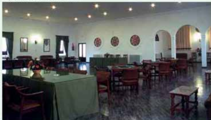
Aspecto de uno de los salones

Al acercarse a ella, creyendo que estaba muerta, se sorprendió al comprobar que ésta vivía y que los movimientos renqueantes del animal habían desaparecido, curándose de sus males. La noticia se difundió entre los ganaderos y habitantes de la zona que, durante años, utilizaron los fangos y charcos de la finca para curar algunas enfermedades de sus animales.