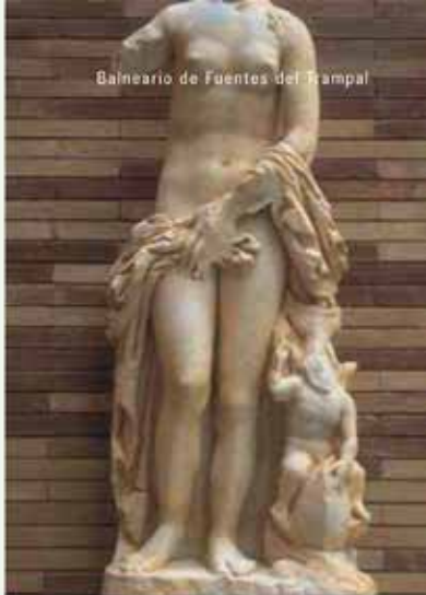
Mérida. Museo Nacional de Arte Romano