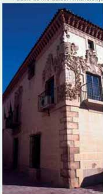
Palacio de Monsalud. Almendralejo

No faltan en Alange bellos rincones ajardinados y zonas en el extrarradio por donde poder pasear y contemplar los hermosos paisajes de los valles ribere-