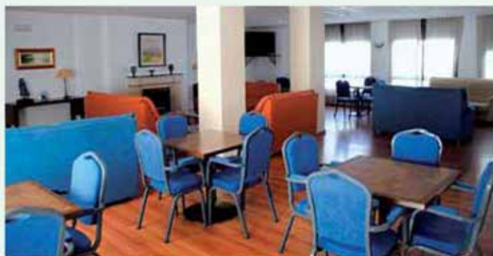
Interior del balneario

miento de Brozas, en su intento por conseguir un Balneario tan acogedor como el actual, teniendo previsto hacer mejoras en las instalaciones y técnicas termales.