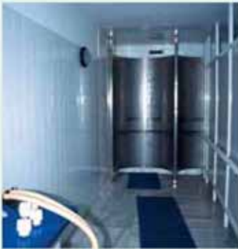
Baño termal de chorro