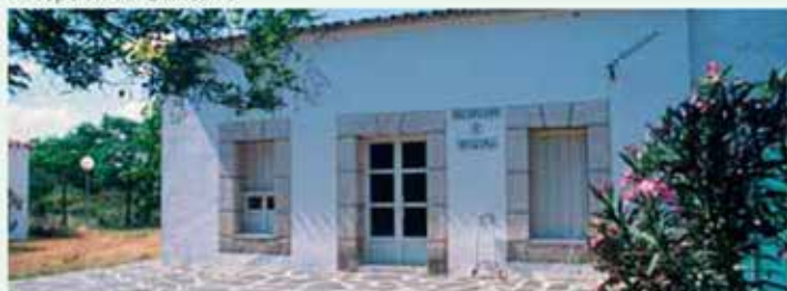
Recepción del Balneario