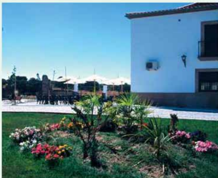
Jardines y vista de los alojamientos

de aerosoles sónicos e inhalaciones húmedas, así como parafangos, parafina y presoterapia.