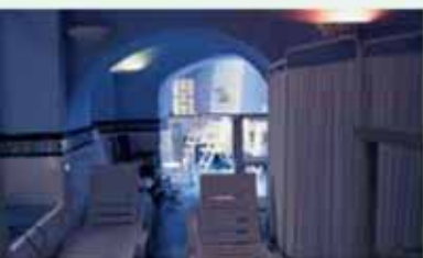
Solarium y zona de descanso