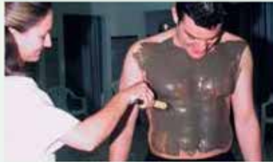
Aplicación de lodo natural