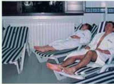
Zona de relax