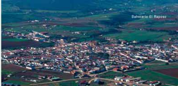
Vista aérea de Puebla de Sancho Pérez.