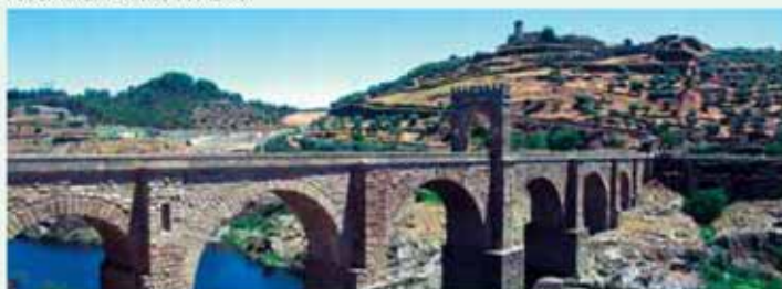
Alcántara. Puente romano

La Iglesia Santa María la Mayor, uno de los edificios religiosos más atractivos de Extremadura, es de estilo gótico-renacentista y fue construida entre los siglos XVI y XVIII. Tanto el interior como el exterior, realizados en sillería, son de una belleza admirable.