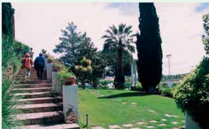
Zona de descanso

mente, incluso como zona de recreo para los habitantes de Emerita Augusta, que dista escasamente 18 kms. por una vía trazada casi ribereña de los ríos Matachel y Guadiana, que une aún hoy día estas dos poblaciones.