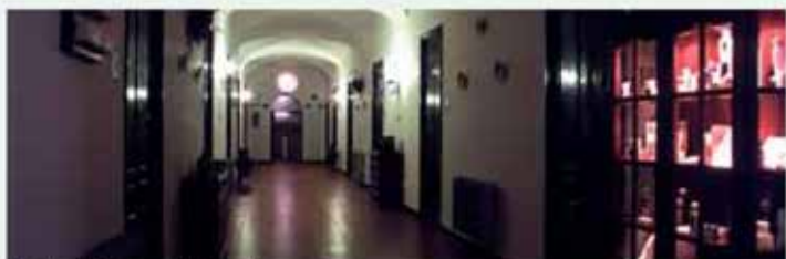
Pasillos inferiores del Hotel

dedicado a Hotel actualmente y también, aprovechando la energía que aporta las instalaciones de placas solares, se va a construir una piscina climatizada en los jardines del Balneario con paredes de cristal.