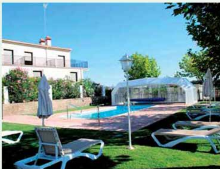
Piscina y zonas exteriores ajardinadas

desde el año 2000 de unos modernos alojamientos con habitaciones exteriores, restaurante y cafetería, que se suman a las dependencias termales ampliadas considerablemente y equipadas con modernas técnicas; todo ello rodeado de bellos jardines, terrazas exteriores y un entorno característico de estas tierras extremeñas donde predominan las grandes extensio-