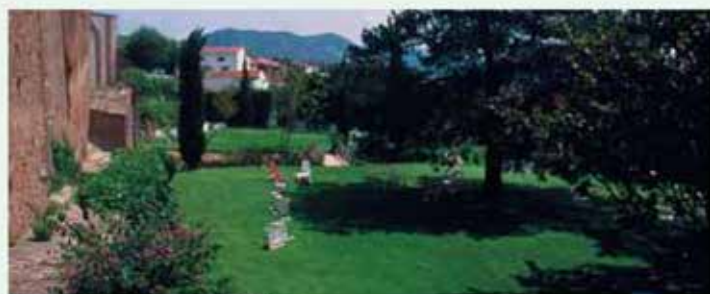
Exterior termas romanas y jardines