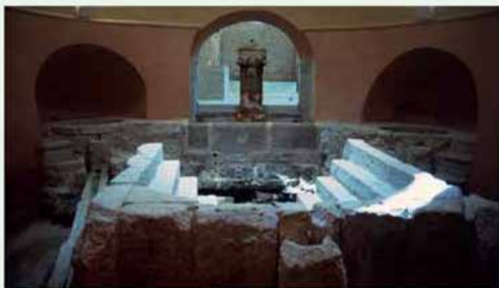
Antiguas termas romanas