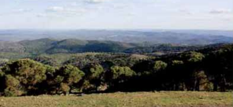
Entorno del Balneario

rencias interesantes acerca del origen y uso de las aguas de Fuentes del Trampal, famosas dentro y fuera de Extremadura. El uso popular de estas aguas oligometálicas por los vecinos de poblaciones cercanas e incluso de zonas alejadas, que se bañaban en "tinajas" existentes en este lugar y que demuestran las notables mejorías de aquellos que las "tomaban", aparecen tanto en periódicos como en revistas especializadas de décadas pasadas. Estos baños serían conocidos primitivamente con el nombre de "El Trampal", término muy común en la zona y que cuenta con su más famoso ejemplo en la cercana e importante Basílica hispano-visigoda de Santa Lucía del Trampal, que dista escasamente unos kilómetros del lugar donde se encuentra ubicado el actual Balneario de Fuentes del Trampal. En el S. XIX son varias las citas científicas que explican las propiedades de las aguas de este