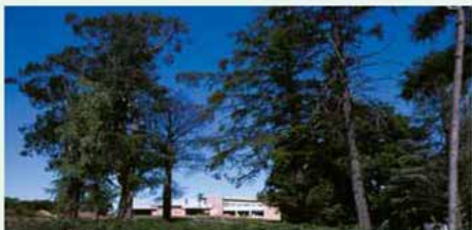
Balneario El Salugral