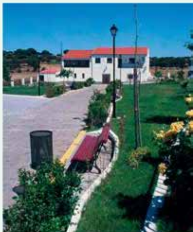
Zona de descanso del Balneario