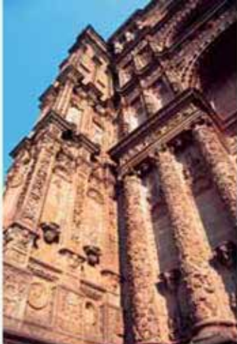
Catedral de Plasencia