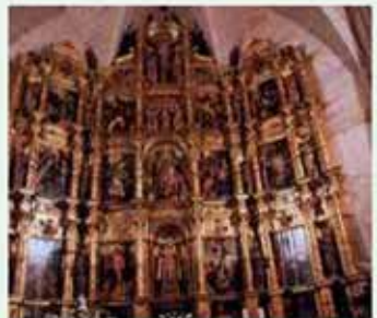
Arroyo de la Luz. Retablo de Luis de Morales

A pocos kilómetros de Brozas está Cáceres, Patrimonio de la Humanidad, con una conservación de su "casco antiguo" elogiado. El Museo Provincial de Cáceres es visita obligada. El aljibe que existe en sus sótanos está conservado admirablemente.