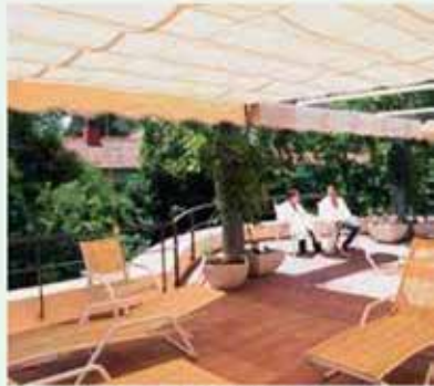
Terrazas del Balneario