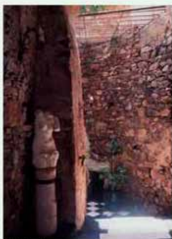
Bajada a las termas romanas

ción romana de buena parte de Extremadura como provincia romana con el nombre de Lusitania y que tuvo su capital en Emerita Augusta, la actual capital autonómica Mérida.