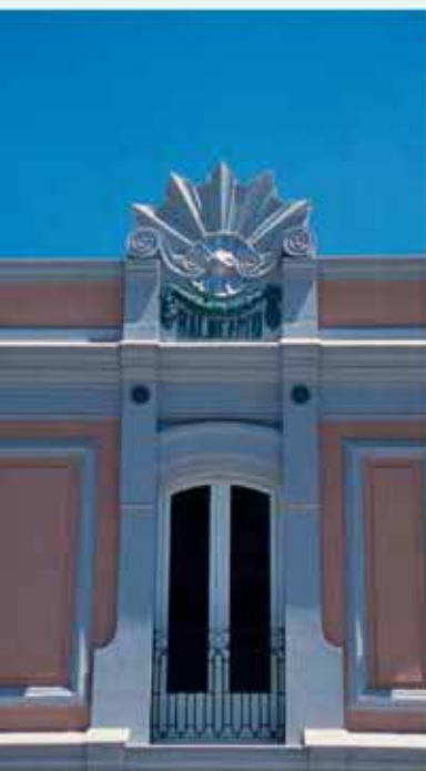
Detalle de la fachada del Balneario