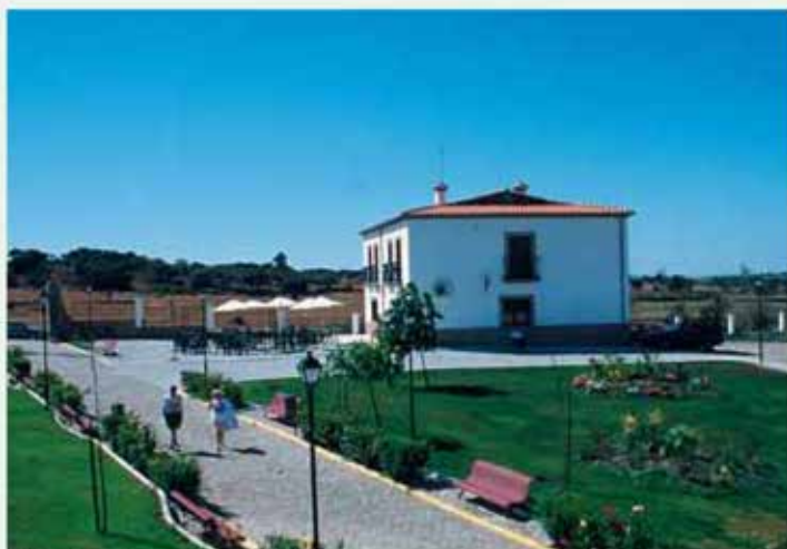
Vista de los alojamientos del Balneario