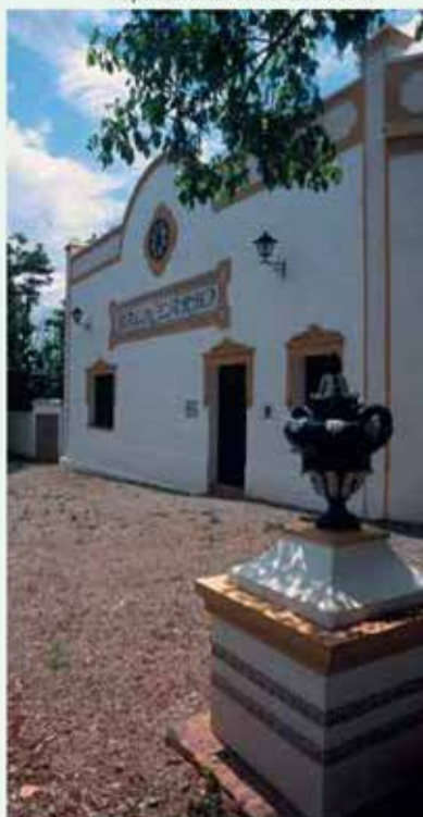
Aspecto exterior del Balneario

C/ Alcazaba, s/n Tfno.: 924 56 32 12 Fax: 924 55 38 88