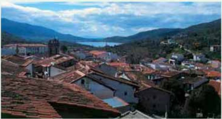
Panorámica de Baños de Montemayor

impresionante y bien cuidado Barrio Judío, declarado Conjunto Histórico-Artístico, así como la Iglesia Parroquial de Santa María, de estilo renacentista del S. XVII, la Iglesia de San Juan, en estilo barroco del S. XVII y el antiguo Convento de los Padres Trinitarios, convertido hoy en magnífica hospedería.