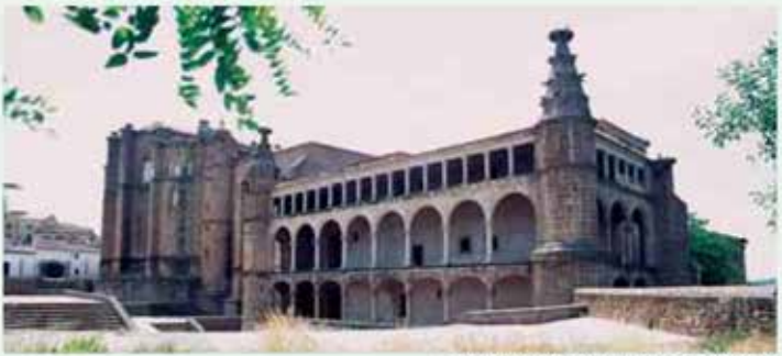
Alcántara. Conventual de San Benito