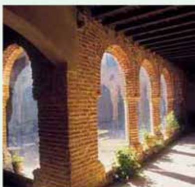
Claustro mudéjar del Monasterio de Tentudía