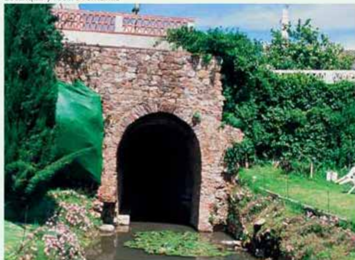
Estanque y restos romanos