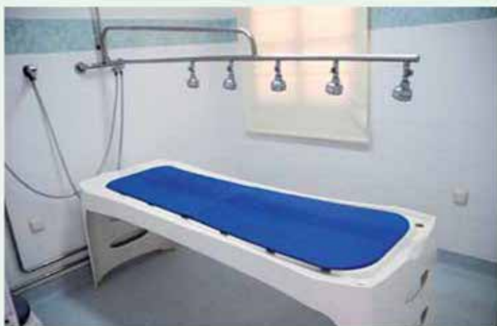
Sala de masajes

Destacable es sin duda la elogiable tarea que durante años ha venido realizando el Ayunta-