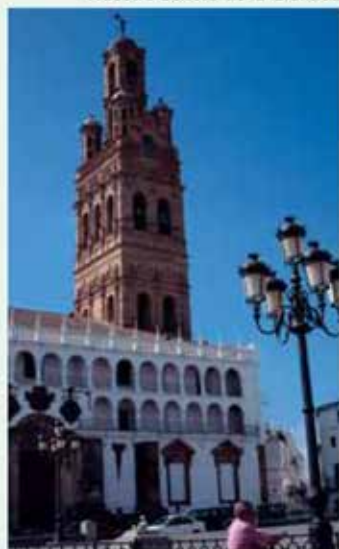
Nuestra Señora de la Granada

Desde Fuente de Cantos podemos llegar a Monesterio , centro chacinero de embutidos y de producción del jamón ibérico de gran importancia y en cuyas cercanías podemos conocer el impresionante y maravilloso Conventual San-