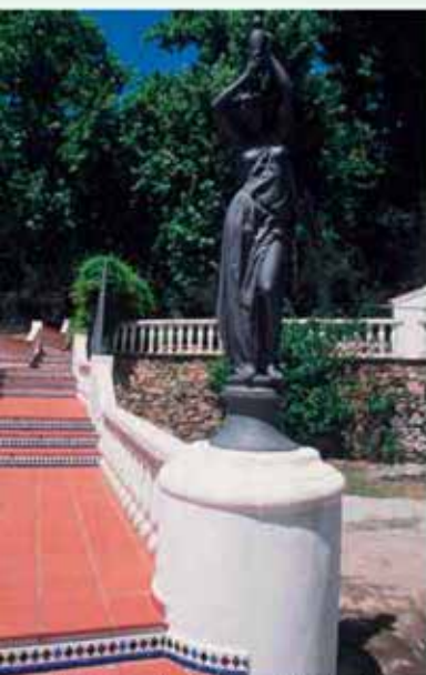
Entrada a los jardines del balneario