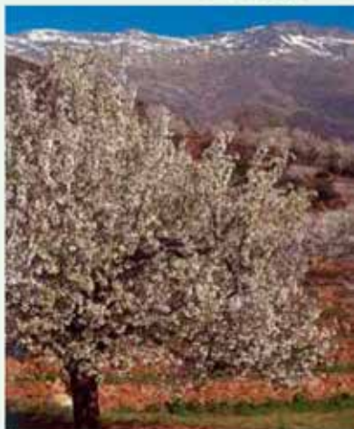
Sierra de Gredos