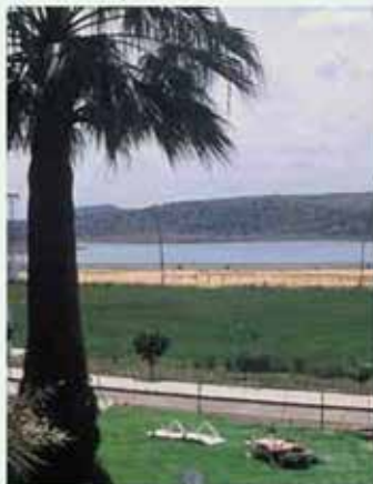
Vista de los jardines