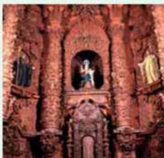
Brozas. Retablo Santa María la Mayor