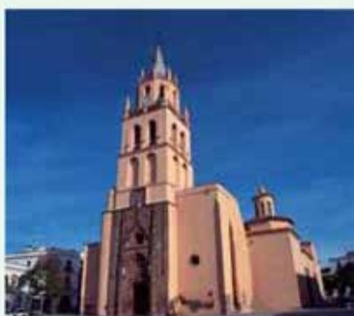
Ntra. Sra. del Valle. Villafranca