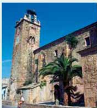
Navas del Madroño. Iglesia Parroquial

paisaje es muy atractivo. No faltan zonas de pesca de la tan apreciada tenca a muy poca distancia, lugares estos que también se han convertido en zona de estacionamiento de aves migratorias, cigüeñas negras, blancas y multitud de rapaces como los milanos y otras aves "dueñas" de estas tierras.