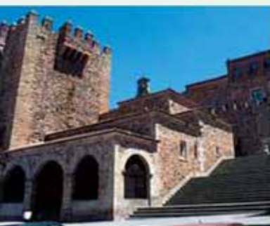
Cáceres. Casco histórico