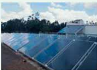
Instalaciones de energía solar