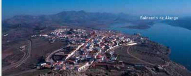
Vista de Alange y su embalse desde el castillo

Se recomienda, a quienes deseen ser atendidos con mayor desahogo, acudir en los meses de junio, julio y octubre. El Balneario tiene conciertos con el INSERSO para subvenciones a la 3ª Edad y Jubilados y con la Junta de Extremadura.