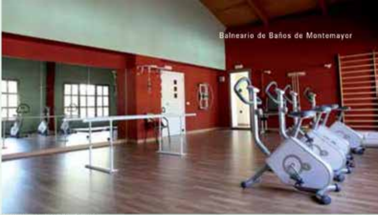
Gimnasio del Balneario

de lo que pudieron ser las primitivas termas romanas que, con el tiempo, se perdieron con posteriores construcciones y reedificaciones de estos lugares.