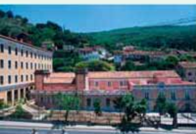
Vista del Balneario y altos del pueblo

ca de dominación de estos territorios por los romanos y más concretamente en momentos republicanos, lo que le daba una cronología de las más antiguas de la Península Ibérica.