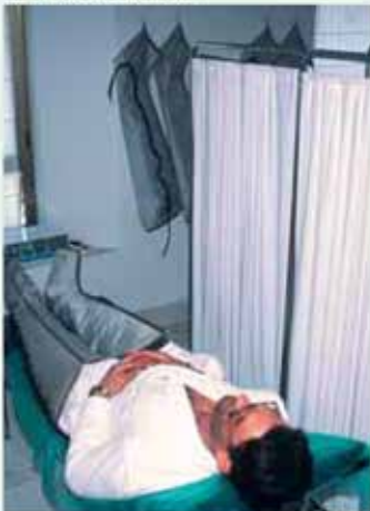
Sala de presoterapia