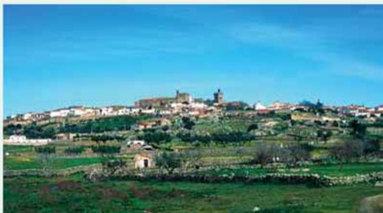
Panorámica de Brozas