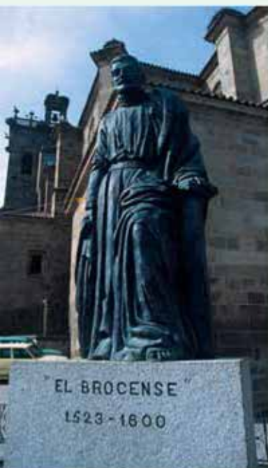
Brozas. El Broicense