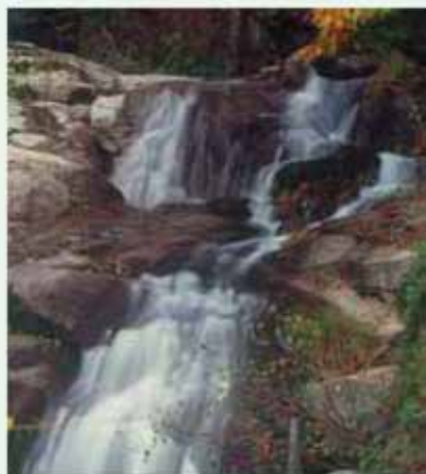
Salto de agua

A poca distancia de la población de Jerte , donde se pueden visitar las fábricas de alabastros, los amantes de la naturaleza podrán disfrutar con el recorrido al Centro de Interpretación y a la Reserva Natural de la Garganta de los Infiernos , auténtico paraíso natural donde se mezclan componentes tan atractivos como son su flora y fauna junto con las gargantas de aguas cristalinas que vierten al río.