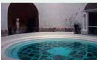
Terma romana de mujeres

bicarbonato ferroso, cálcico, sulfato magnésico y cálcico, cloruro sódico y magnésico y ácido metafilífico. El caudal del manantial es de 316 litros por minuto.