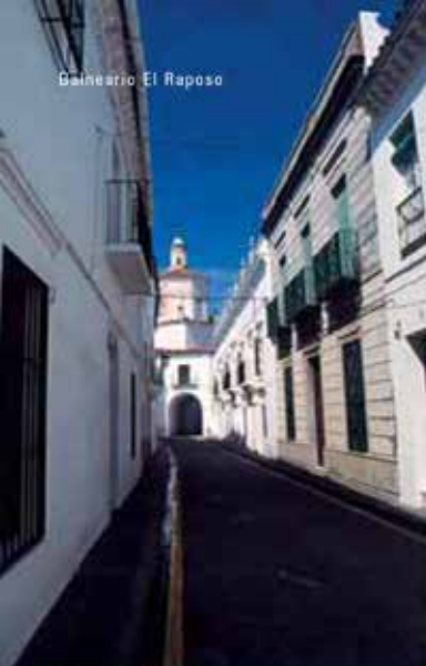
Llerena. Calle típica