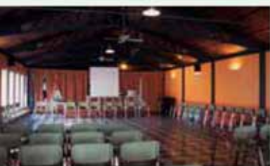
Salón de actos