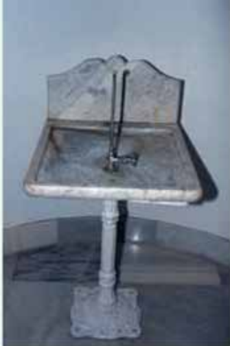
Antigua fuente del mármol

Modificaciones de importancia y paulatinas ampliaciones de considerable coste se darían en los