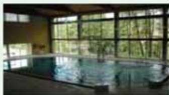
Balneario El Salugral