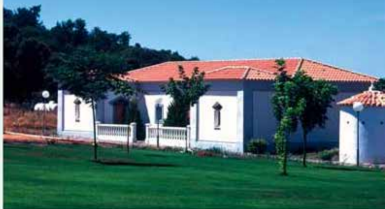
Vista del Balneario