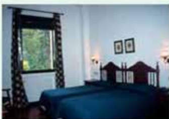
Dormitorio del Hotel Balneario

Como construcciones a realizar a corto plazo destacan las nuevas plazas hoteleras que se ubicarán en la planta segunda del edificio