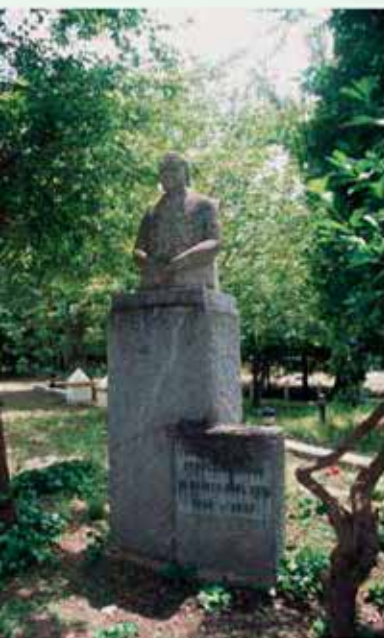
Monumento a Dª Fernanda Durán