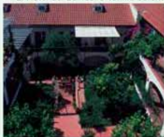
El Hotel del Balneario Varinia Serena