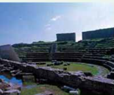
Teatro romano de Regina