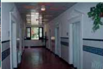
Zona de Baños